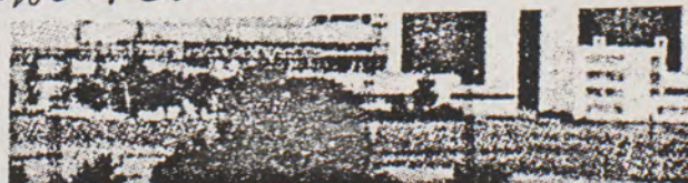
Een gedeelte van het kerncentralecomplex in het Bulgaarse Kozlodouj met zijn vier 'zeer gevaarlijke', uit 1969 daterende, reactoren.

Israel protest wants those people to come all to Israel to help populate the west bank (I suppose)