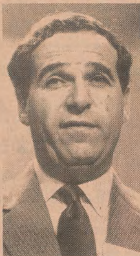
Leon Brittan : mandaté.

Les raisons de la colère ? Depuis le 1 er janvier dernier, la nouvelle législation européenne, en contrepartie d'une